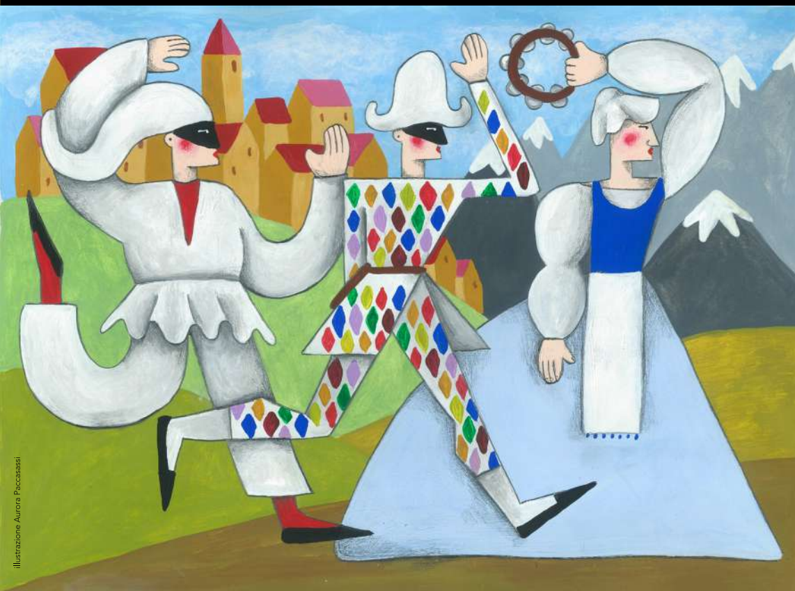
Illustrazione Aurora Paccasassi

SPETTACOLI GRATUITI TERRITORIO-ARTE-TURISMO-CULTURA